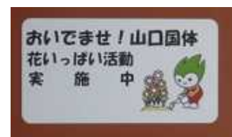
プランタにつけたラベル